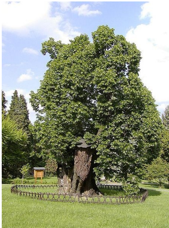
"Mátyás király fája" Bajmócon (Bojnice) a vár udvarán

Bajmócon (Bojnice), nem is Magyarországon van (Trencsén), egy nagylevelű hársfa ( tilia platyphyllos ), a várkastély bejáratának közelében, melyet Mátyás király fájának is neveznek. Kerülete 1250 cm, azaz 12,5 méter, de ez esősorban a képen is jól látható föld közeli terebélyesedésének, szétágazásának köszönhető.