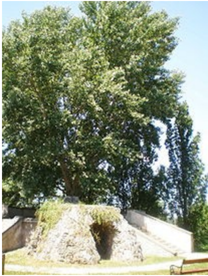
Kont-fája a Khuen-Hédervár kastélykertjében