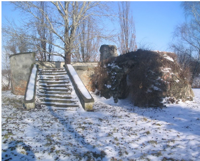
A Kont emlékhely télen

A II. katonai felmérés kataszteri térképén ( innen elérhető ) megtekintjük Győr vármegyét (oda tartozott akkor Hédervár), azon beazonosítható maga a Kont fa (bátran fel kell telepíteni a szoftvert, amire felhív a kataszter). Mivel modern világunkban ismerjük GPS koordinátáit (47.8323 / 17.4577) és térképe is adott - sőt az Árpád fáé is -, azt műhold 'üzemmódban' könnyen összehasonlíthatjuk a megfelelő kataszteri térképpel (azon is van koordináta jelzés, bár némileg más értéket mutat: 47.49'51" / 17.27'13", a 19. sz. szelvény a kastély és az ún. Pimpinellás kert között a francia kertben). Tessék, máris ugrottunk vagy 300 évet. Hol van Däniken?