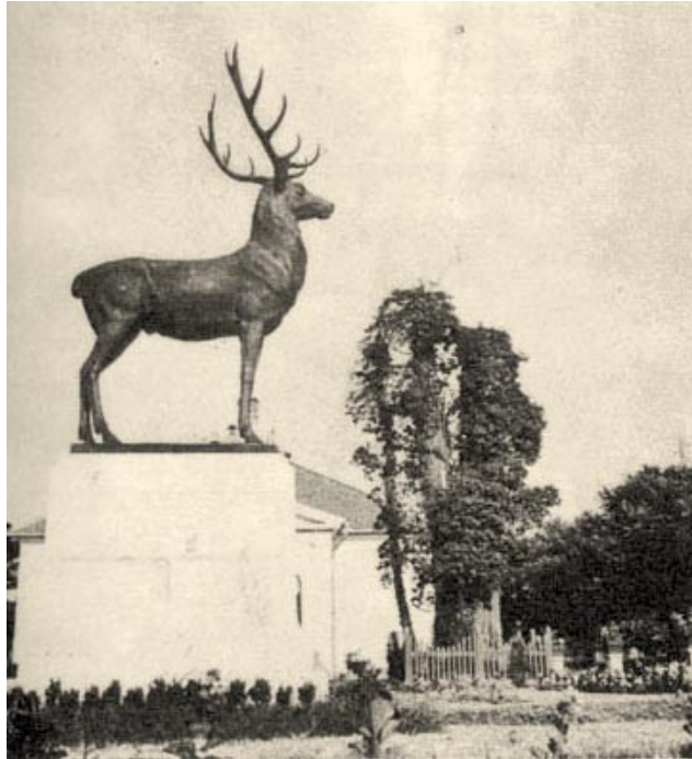
A már kihalt és borostyánnal felfuttatott Tessedik Emlékfa

Az akácfa (fehér akác, rubina pseudoacacia ) ellenben nem. "Fiatal korában rendkívül gyorsan növekszik s a törzshajtások rohamosan fejlődnek.[...] Igen magas életkort az Akácfa nem ér el, 40-50 éves kora után csekély gyarapolást mutat és 100 éven túl élő fák a ritkaságok közé tartoznak. Az Akácfa a hegyes éghajlatot nem kedveli, hanem a délibb fekvésű dombvidék s a síkság fája;..."