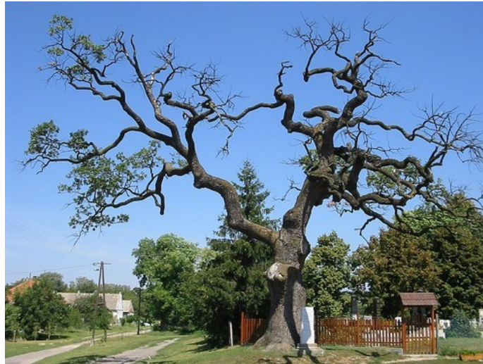
Rákóczi fája Ordason

Károlyfalva: Egy Sárospatak melletti faluról van szó, melyet Rákóczi száműzetése után telepítettek be, így a névadás egy németajkú közösségben történt, külön érdekességként a jelenségnek. A Hosszúhágón álló fa Vágáshuta felé, az országos kék túra vonalán áll , ezt lehet többen láttatok.