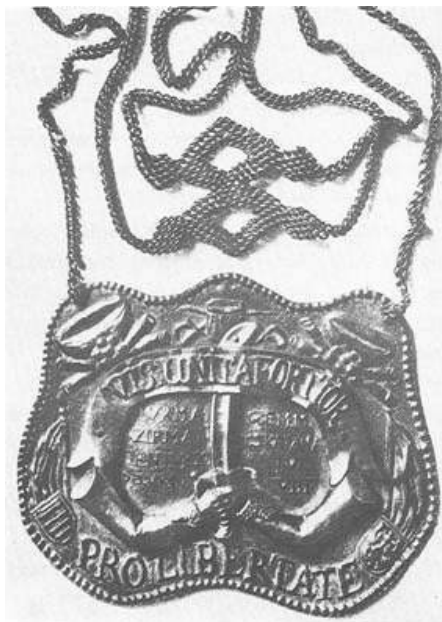
Az Ocskay-ezred tarsolylemeze

Forgách Simon mint császári ezredes, majd tábornok sajátította el a török, majd a nyugati hadszíntéren a háború tudományát. Előzőleg a császári seregben szolgált többek között Czelder Orbán és Ocskay László is.