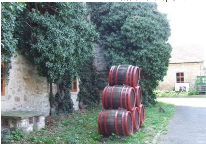
Sárospatak Rákóczi Pince:

Ami még nagyon rossz benyomást tett ránk, az a többi borászat kibeszélése volt. Ilyet nem lenne szabad megengedni, még akkor sem, ha őszintén hiszik (ami jó), hogy az ő boruk a legjobb! Csalódottan jöttünk el, ezen még a finom pogácsa se változtatott, amit a kóstoló mellé kaptunk.