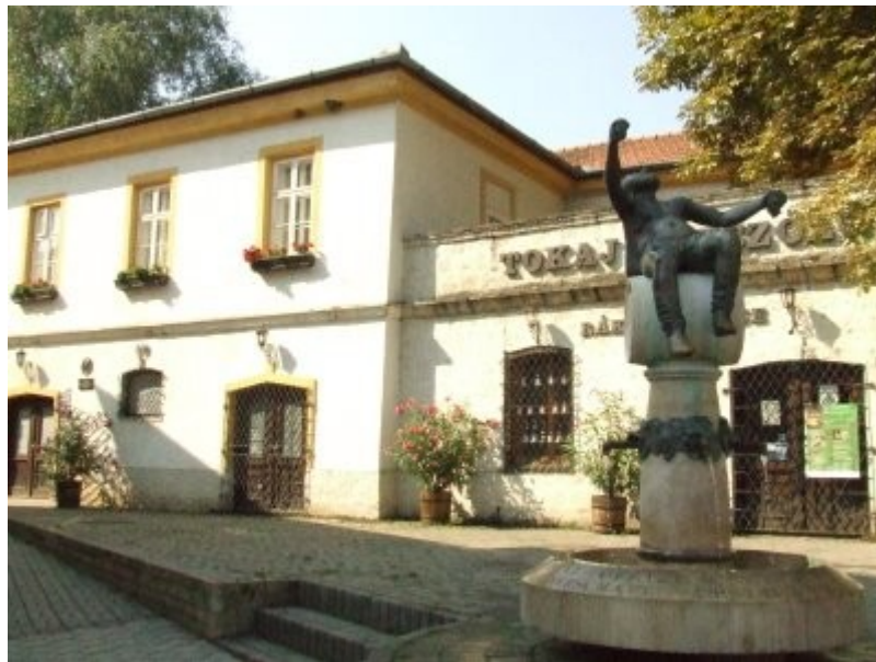
Tokaj Rákóczi pince:

Kezdeném a rossz tapasztalattal, maradjon a végére a jó, hiszen minden jó, ha a vége jó!