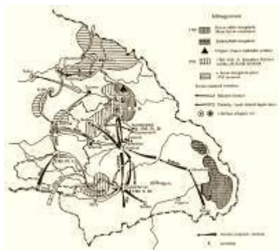
45. térkép. A Rákóczi-szabadságharc – a kuruc mozgalom gócai, 1702–1703

{895.} Legerősebb bázisa a Székelyföldön alakult ki. 1702 elején arra a hírre, hogy a székelyek rebellálni készülnek, a Gubernium általános vizsgálatot rendelt el. A vizsgálat ugyan semmit nem derített ki, de augusztus 15-én Válaszútnál a „kurucok” szabályos csatát vívtak a kolozsvári császári őrséggel.