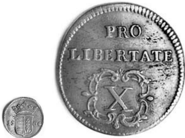
__ Libertas . II. Rákóczi Ferenc