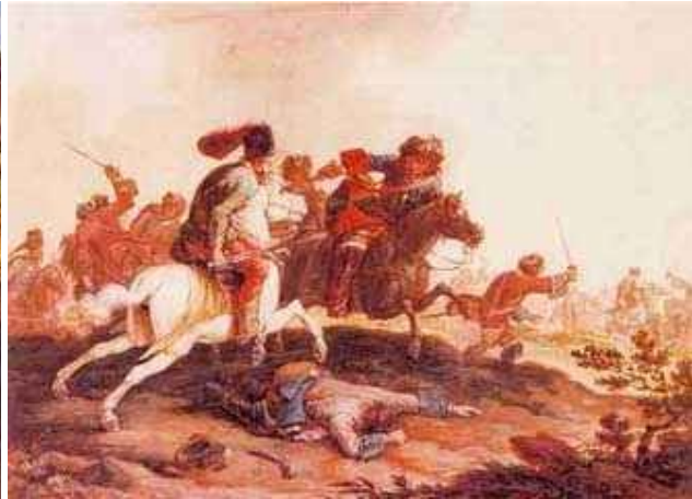
Ismeretlen mester: Kuruc-labanc összecsapás