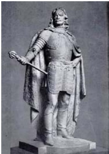
Kisfaludy Strobl Zsigmond: II. Rákóczi Ferenc (A budapesti Hősök terén található szoborcsoport tagja)