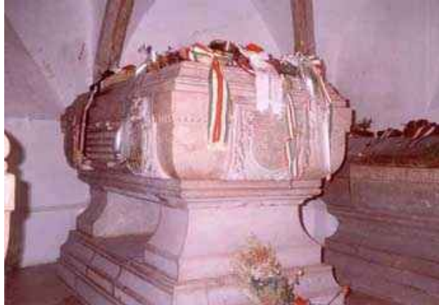
Rákóczi sírja Kassán

A fejedelem 1735 nagypéntekjén halt meg, hamvait 1906-ban hozatta haza a magyar kormány, és Kassán, a bazilikában –édesanyja és fia hamvaival együtt– helyezték örök nyugalomba.