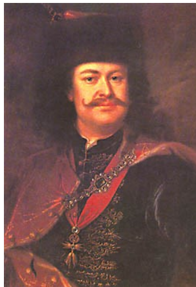
Mányoki Ádám: Rákóczi Ferenc, 1712.