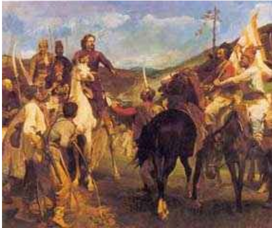
Veszprémi Endre: II. Rákóczi Ferenc és Esze Tamás találkozója