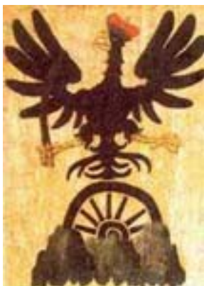
Zászló a Rákóczi család címerével

E z a küldetéstudat kísérte végig egész életében. A Rákóczi családban a Habsburgok elleni harcnak régi hagyománya volt. Ősei között pedig négy erdélyi fejedelem is található. Édesapja I. Rákóczi Ferenc, erdélyi fejedelem, aki meg sem ismerte fiát, mert még születése előtt meghalt. Édesanyja, Zrínyi Ilona, két kisgyermekével Sárospatakon élt, és teljesen magyar nevelést biztosított gyermekeinek. 1682-ben újból férjhez ment Thököly Imréhez, és Munkács várába költöztek. Boldogságuk rövid ideig tartott. A Thököly felkelés leverése után a váradi basa Thökölyt elfogatta, és Törökországba hurcoltatta.