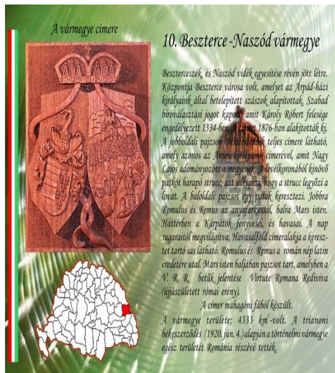
A vármegye címere