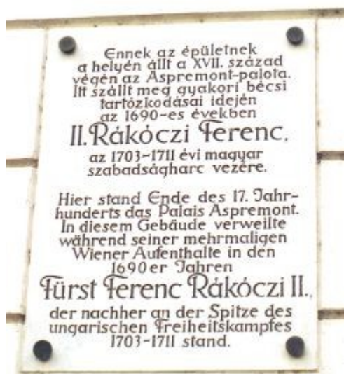
A bécsi Aspremont-palota Rákóczi-emléktáblája

A nyolcvanezer lakosú Bécsben és az Aspremont-házban mozgalmas politikai és kulturális élet fogadta. Tudott valamennyire németül, s a kor divatjának hódolva rászokott a kártyázásra, miközben nyelveket tanult, gyakorolta a vívást, a lovaglást, a táncot, de nem feledkezett meg a matematikáról és az erődítéstanról sem. A Bécsben töltött néhány hónap után itáliai utazás következett. Olaszországból tíz hónap múlva tért vissza, s ekkor, 1694. március 9-én, tizennyolc évesen megkapta nagykorúvá nyilvánítási bizonyítványát. Sógora, Aspremont gróf javaslatára előkelő külföldi származású házasságkötése (1694. szeptember 26., Köln) után november végén érkezett vissza Bécsbe, ahol házi áristomra ítéltetett, mert "a császár tanácsának kikérése és engedélye nélkül" ilyen előkelő házasságot kötött.