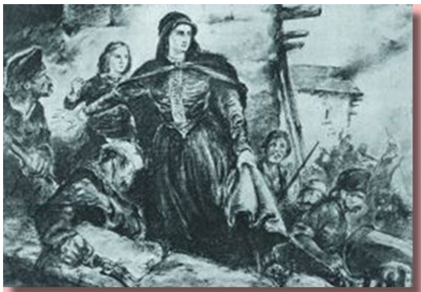
Zrínyi Ilona a várfalon

Zrínyi Ilona nem tehetett mást, mint hogy Munkácson maradt két gyermekével. 1685 végén a császári csapatok körülveszik a utolsó erősséget, Munkács várát is. Zrínyi Ilona három évig védte Antonio Caraffa generális csapatai ellenében Munkács várát. Buda visszafoglalása után a helyzete azonban tarthatatlanná vált, és 1688. január 17-én kénytelen volt a várat feladni, de elérte, hogy a vár védői amnesztiát kaptak a császártól, és hogy a Rákóczi-vagyon gyermekei nevéen maradjon. A megállapodás értelmében azonban Bécsbe kellett mennie gyermekeivel együtt, ahol a megállapodást részben megsértve, gyermekeit elszakították tőle, őt magát pedig zárdába küldték.