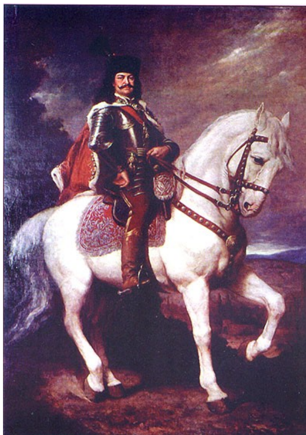
Éder Gyula festménye