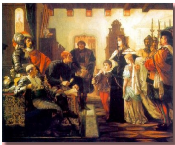
Madarász Viktor: Zrínyi Ilona a vizsgálóbíró előtt