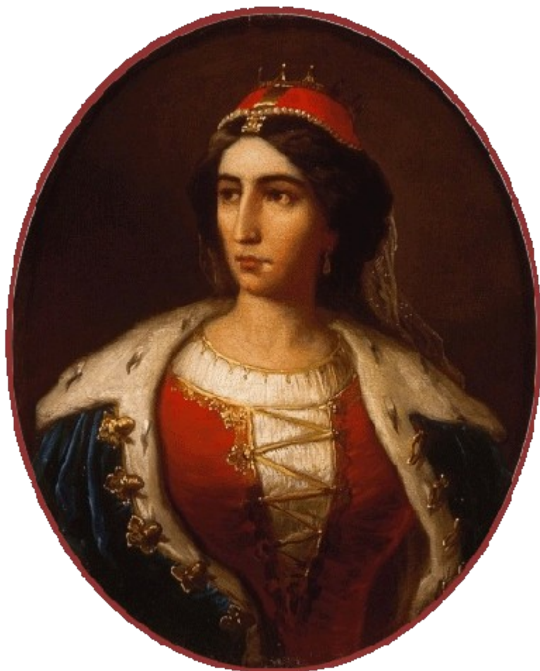
Jakobey Károly: Zrínyi Ilona

IV. Zrínyi Péter bán és Frangepán Katalin leányaként a horvátországi Ozaljvárbán született 1643-ban.