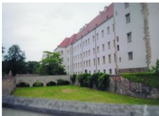
A bécsújhelyi vár mai képe

Munkács várának feladása (1688. január 11.) után Zrínyi Ilonát gyermekeivel együtt Bécsbe, az orsolyita apácák kolostorába vitték. Később a családot szétszakították, az anya nem érintkezhetett gyermekeivel, akik közül Júlia kolostori nevelőintézetbe került, Ferenc pedig a csehországi Neuhausba, az ottani jezsuita kollégiumba. Zrínyi Ilona, kijátszva a császári udvar éberségét 1691. június 24-én egy merész politikai húzással Bécsben férjhez adta lányát Ferdinand Aspremont grófhhoz, aki egy franciabarát német fejedelmi család fia és XIV. Lajos francia király távoli rokona volt. Rákóczi Julianna - már mint Aspremontné - kieszközölte az öccsével való örökség megosztásának lehetőségét, és Rákóczi Prágából 1692 nyarán visszatért Bécsbe nővéréhez, az Aspremont-házba.