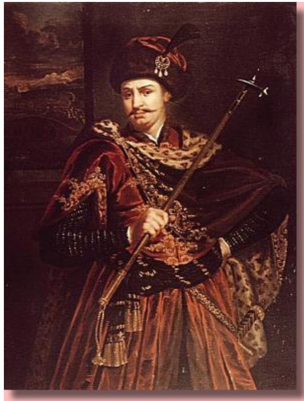
Székely Bertalan: Thököly Imre

Könnyedén irányította az ügyeket, miközben leveleket váltott egy nála öt évvel fiatalabb férfival. Ő volt a késmárki gróf, akit mi Thököly Imre ként ismerünk. A levelek természetesen nem voltak érzelemtől mentesek, sőt még a házasság gondolata is megfogalmazódott bennünk. Erre azonban még pár évig várniuk kellett. A "kuruc király" 1680-ban egy ebédmeghívás alkalmával megcsodálhatta a szépséges jövendőbeliét. Akkor már biztos volt, hogy hamarosan az esküvőre is sor kerül, ehhez azonban szükség volt a bécsi udvar engedélyére. A szerelmeseknek erre 1682 -ig kellett várniuk. Házasságkötésükről még egy francia romantikus regény is született.