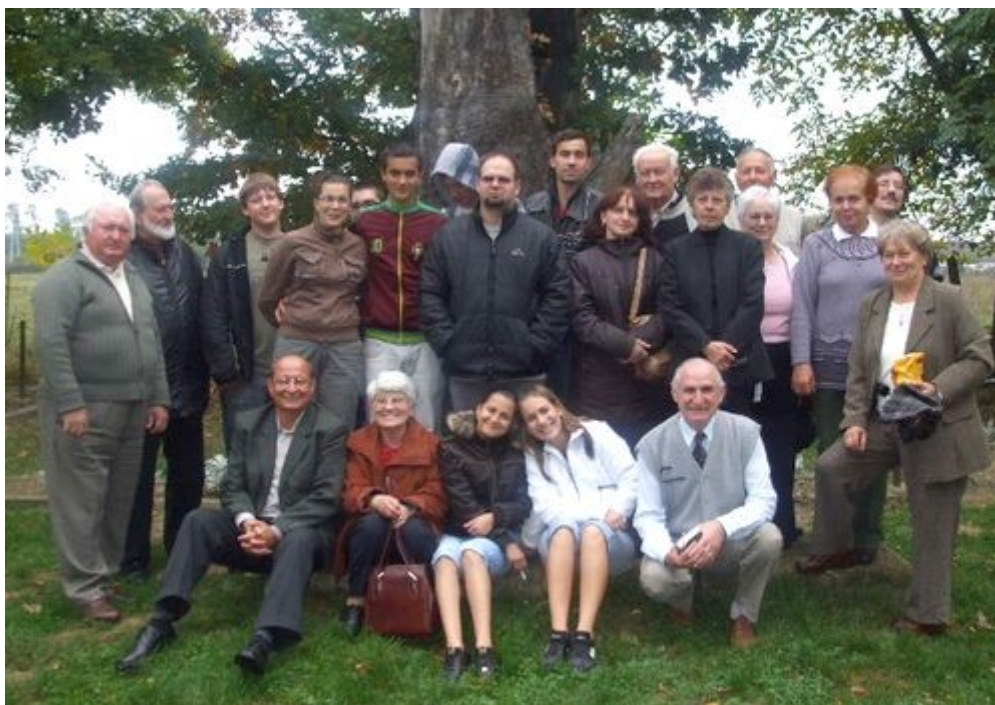
A történelmi emléktúra résztvevői