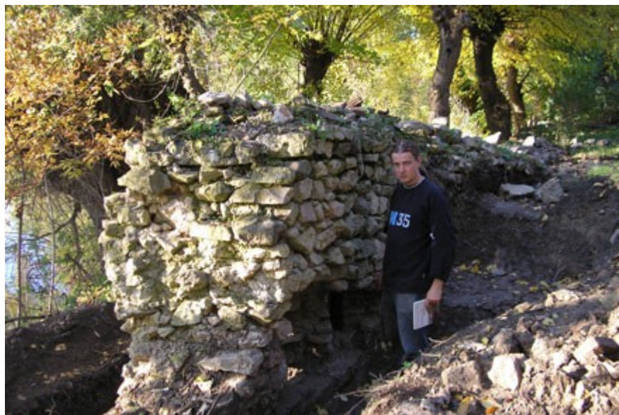
A külső vár délnyugati bástyája bontás közben

4. A várszigetnek nevezett területen (ma csak félsziget, de a középkorban valóban minden oldalról folyó kerítette az erődítményt) ma is található egy belső tó, amely érdekes - félköríves, "kifli" alakú és sokkal mélyebben helyezkedik el, mint az átlag járószint. Ha rátekintünk a várról fennmaradt középkori alaprajzokra, akkor azokon is láthatunk egy belső területet, mely mélyebben fekszik. Ez, a belső várat kerítő szárazárok. Már első ránézésre is világosan látszik a középkori és a mai mélyedés alaprajzi hasonlósága - ezért a mai tó belső oldalán kell elhelyezkedjen a vár legkorábbi része: a négybástyás belső vár az öregtoronnyal és a Mátyás korabeli palotaszárnyal.