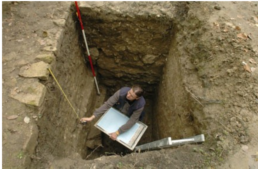
Az ötszög alakú bástya feltárása

2. A vár keleti részén, a 610. helyrajzi számú telken látható egy alaktalan falcsont, amelyet alapként használtak egy 20. században épült házhoz. Ennek középkori eredete szintén valószínűnek tűnt, a házalaptól jelentős mértékben elütő, mészhabarcos kötőanyaga miatt.