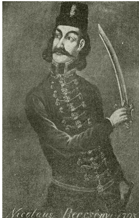
Gróf Bercsényi Miklós 1703-ban. (Egykorú festmény után.) [721]